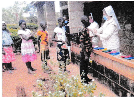
Nasza ostatnia akcja z ukrycia, niedozwolona. Rodzice dzieci czekają na drodze, by nie było tłoku